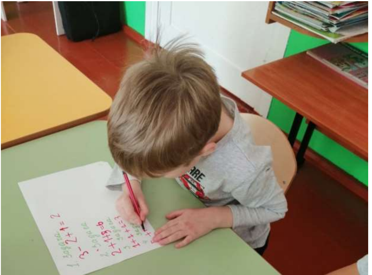
Задание «Составь кодовое слово»